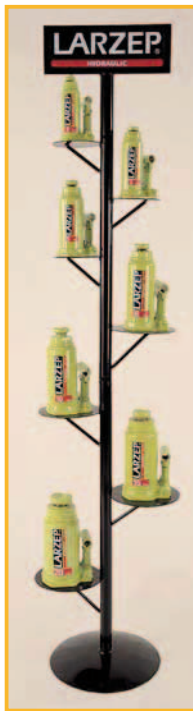
AZ9101 Expositor de gatos Display stand Presentoir